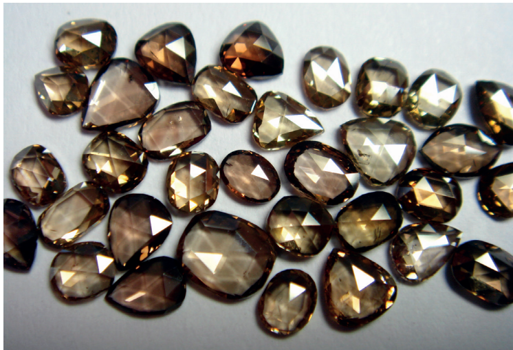
Champagnerfarbene Diamantrosen. / Diamants champagne en taille rose.

Info Dominik Kulsen AG Postfach 2033, 8401 Winterthur Telefon 052 212 24 40 Telefax 052 212 24 41 info@dominikkulsen.com www.dominikkulsen.com