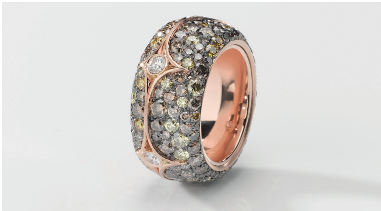
Ring: 750er Rotgold, Brillanten TW, Gelb, Orange, Olive und Champagner. / Bague: or rouge 750, brillants Top Wesselton jaunes, orange, olive et champagne.

Info Dominik Kulsen AG Postfach 2033, 8401 Winterthur Telefon 052 212 24 40 Telefax 052 212 24 41 info@dominikkulsen.com www.dominikkulsen.com