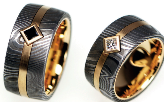
Eheringe: 750er-Gelbgold/Damaszenerstahl, Princess schwarz. / Alliances: or jaune 750, acier de Damas, princesse noir.

Un diamant d'un rose tendre peut dénoter une féminité romantique tandis que celui d'un rose intense est le signe d'une féminité assumée. Les alternatives très prisées au diamant incolore, à la brillance en comparaison froide, sont les Diamants de Couleur Naturelle champagne clair et cognac foncé; une douce chaleur et une discrète individualité s'en dégagent.