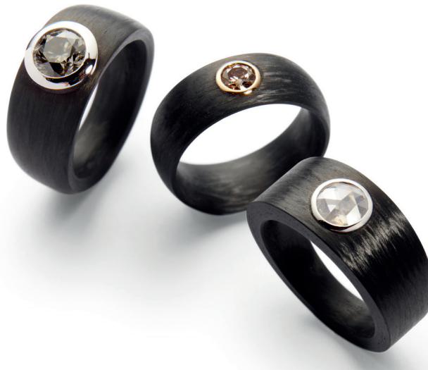
Damenringe: Carbon/750er Weiss- und Roségold, Brillanten Tief Bräunlich Grau und Braun, Diamant-Rose Fancy Weiss. / Bagues femme: carbone/or blanc et rose 750, brillants gris brunâtre profond, diamant blanc en taille rose.

Les Diamants de Couleur Naturelle présentant une couleur rare telle que le bleu, le rose ou le vert attirent régulièrement l'attention du public grâce à des résultats de ventes aux enchères sensationnels. Les diamants roses ou jaunes qui étincellent sur les onéreuses bagues de fiançailles de stars telles que Jennifer Lopez, Mariah Carey ou Heidi Klum, se font aussi remarquer. Néanmoins, jusqu'à aujourd'hui, peu de clients savent qu'ils disposent d'une large offre de Diamants de Couleur Naturelle pouvant aussi entrer dans leur budget et ce, dans toutes les teintes, dans différentes grosseurs et dans diverses tailles.