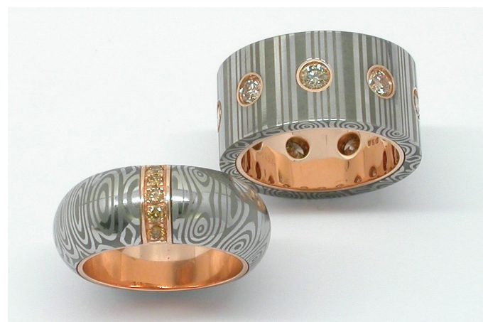
Links: Damaszenerstahl/750er Rotgold, Brillanten Champagner. Rechts: Damaszenerstahl/750er Rotgold, Brillanten Orange Braun. / A gauche: acier de Damas/or rouge 750, brillants champagne. A droite: acier de Damas/or rouge 750, cinq brillants orange brun.