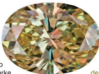
Ovaler Brillant Fancy Intense Yellow, Dominik Kulsen AG.

Nicht immer ist Stickstoff im Diamanten farbgebend. Wenn zwei oder vier Stickstoffatome eine Leerstelle im Kohlenstoffgitter umgeben (so genannte A- und B-Aggregate), ergibt sich keine Absorption und daher keine Farbe. In allen anderen Fällen verursacht Stickstoff – ob einzeln oder in Gruppen – eine mehr oder weniger starke gelbe Färbung des Diamanten. Die gewöhnlichste Präsenz von Stickstoff im Diamanten ist die Gruppierung von drei Stickstoffatomen um eine Gitterleerstelle (N3-Aggregat genannt). Sie ist für Tönungen von der fast nicht wahrnehmbaren Verfärbung bei farblosen Diamanten bis zu schwachen gelben Farben verantwortlich. Intensivere gelbe Farben kommen bei Diamanten mit hohen Konzentrationen von N3-Aggregaten vor. Vereinzelte (isolierte) Stickstoffatome, die für sehr intensive oder tief gelbe bis orangefarbene Farben des Diamanten verantwortlich sind, kommen sehr selten vor.