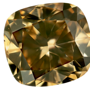
1.15 ct, SI Mittleres Champagner (C4), Dominik Kulsen AG.

Dans le commerce, la taille coussin, connue par ailleurs sous le terme de Cushion Cut, est parfois aussi nommée coussinet. Les certificats GIA la désignent sous l'appellation de Cushion Modified Brilliant. La taille coussin allie la modernité de la taille brillant ovale au charme ancien de la taille Old Mine, cette dernière étant le direct précurseur de la taille brillant telle que nous la connaissons aujourd'hui. La taille coussin, volumineuse et relativement haute, préserve particulièrement bien la couleur d'un diamant et c'est ce qui la rend si populaire surtout pour les diamants d'une certaine grosseur.