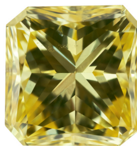
0.55 ct SI Fancy Intense Yellow, Dominik Kulsen AG. 0.55 ct SI Fancy Intense Yellow, Dominik Kulsen AG.

Square Modified Brilliant» (radiant carré). La particularité de la taille radiant est qu'elle associe la sereine élégance d'une taille à degrés au feu d'une taille brillant.