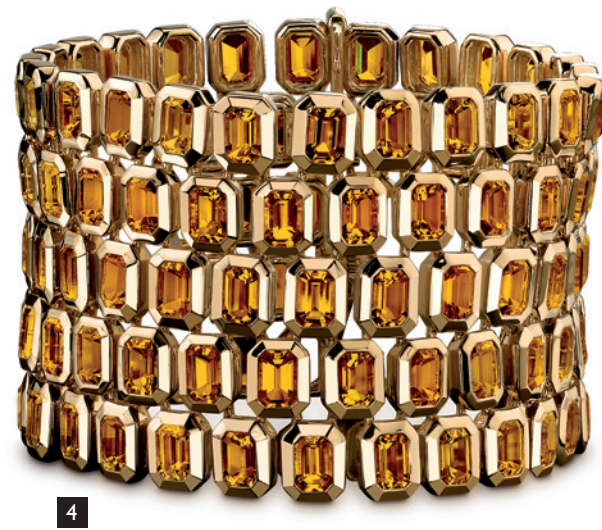
1. Anhänger und Ring aus der „Fashion“-Kollektion von DIGO mit farbigen und weißen Diamanten, gefasst in Weißgold 2. Citrin-Anhänger, gefasst in 585 Gelbgold, am Seidenband, von ERNST STEIN 3. Bicolor-Turmalin von GROH + RIPP 4. Citrin-Armband aus der „Angelina Jolie“-Kollektion von MIORI in 750 Gelbgold 5. Trillionpampel aus brasilianischem Lemonquarz (23,64 Karat) von BERCKWERK 6. „My little Mystery“-Glamour-Ring von MEISSEN in 750 Roségold mit einem weißen zentralen Diamanten (0,07 Karat) und 22 weißen Diamanten (0,20 Karat), Meissener Porzellan in Tangerine Orange und einem Bergkristall 7. Ring aus der „Candle in the wind“-Kollektion von NANIS mit einem Citrin und Diamanten, gefasst in Gelbgold 8. Ringmodell „Lava“ von ITALIAN DESIGN mit Feueropal und Diamanten, gefasst in Roségold 9. Set mit Bergkristallen im Munsteiner-Schliff von CÉDÉ, gefasst in Gelbgold 10. Ceylon-Saphir, nicht erhitzt (13,50 Karat), von KARL FALLER 11. Diamant in der Farbe Fancy Intense Yellow von KULSEN & HENNIG 12. Ovaler Canary-Turmalin im Scherenschliff aus Malawi (14,13 Karat) von CONSTANTINWILD