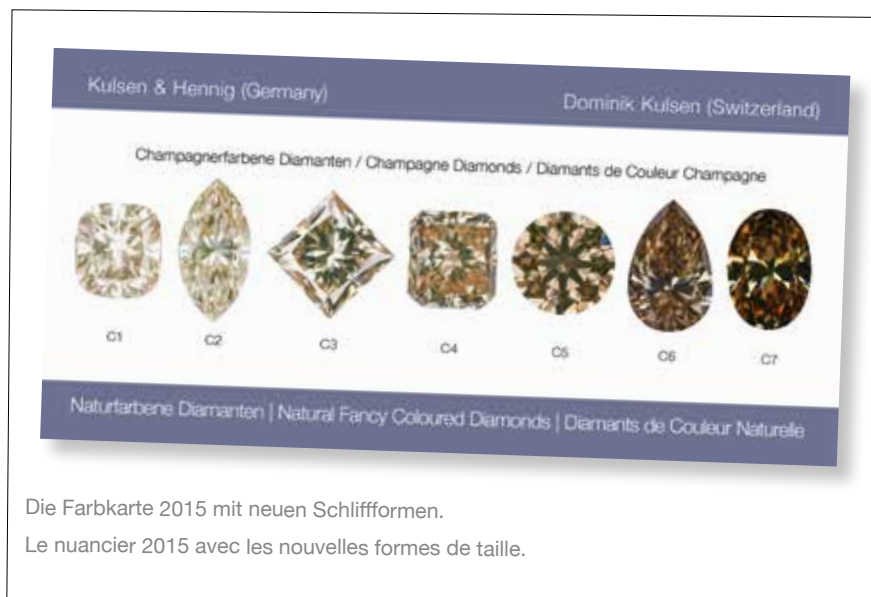
Die Farbkarte 2015 mit neuen Schliffformen. Le nuancier 2015 avec les nouvelles formes de taille.

La maison Dominik Kulsen AG, établie à Winterthur, et la société allemande Kulsen & Hennig GbR sont les spécialistes des diamants de couleur naturelle. Depuis cinq ans, les deux entreprises proposent à leurs clients des nuanciers qui existent déjà pour les teintes jaune, rose, orange, gris et champagne. Ce dernier jeu se présente cette année sous une forme inédite qui reproduit l'échelle de teintes utilisée pour les diamants Argyle taillés, dans les coloris C1 à C7. Les tonalités de brun sont les plus fréquentes pour les diamants de couleur naturelle et leur palette s'étend d'une nuance de brun tendre ou plus prononcée jusqu'à un brun orange, gris ou rouge saturé. Le concept de «diamants de couleur champagne» bénéficie désormais d'une reconnaissance internationale. Dans leur majorité, ils proviennent de la mine australienne d'Argyle, connue pour recéler également les plus beaux spécimens.